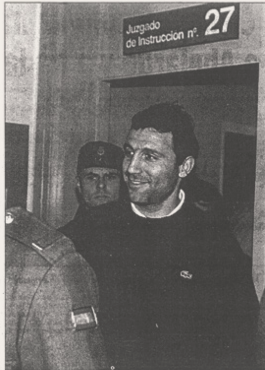
Stoichkov denunció la utilización indebida de su imagen

Se espera que el propio Maldini y el Milán se constituyan en parte acusadora habida cuenta que su ima-